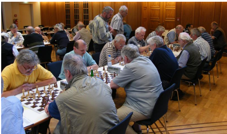
Erste Runde des Schnellschachturniers