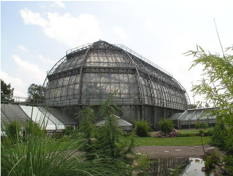
Tropenhaus des Botanischen Gartens

Ebenfalls am 19.08.10 um 17:00 findet eine Führung durch den Botanischen Garten statt. Treffpunkt ist um 15:30 Uhr am Eingang des Hotels Christophorus. Im Unkostenbeitrag von 20,- ist der Bustransfer und der Eintritt enthalten. Der Botanische Garten in Berlin ist ein Highlight, das aber nicht so im Rampenlicht steht. In den vergangenen Jahren wurde das große Tropenhaus komplett renoviert und umgestaltet.