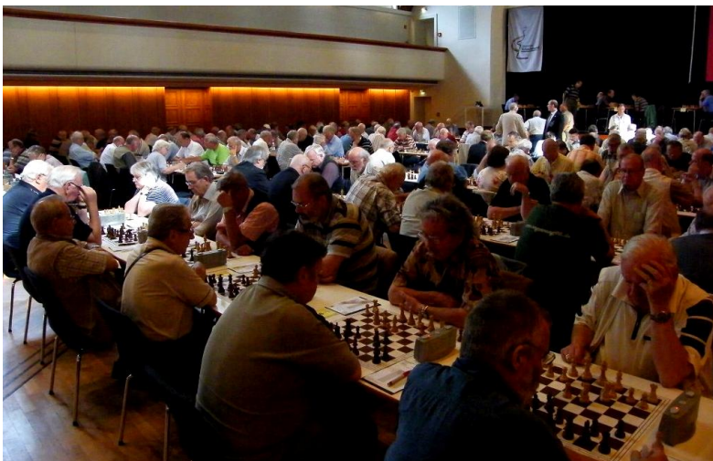
Impression von der ersten Runde 1

Am 17.08. findet abends ein Schnellschachturnier im Turniersaal statt. Anmeldemöglichkeit besteht bis kurz vor den Turnierbeginn um 18:00 Uhr am Schiedsrichtertisch.